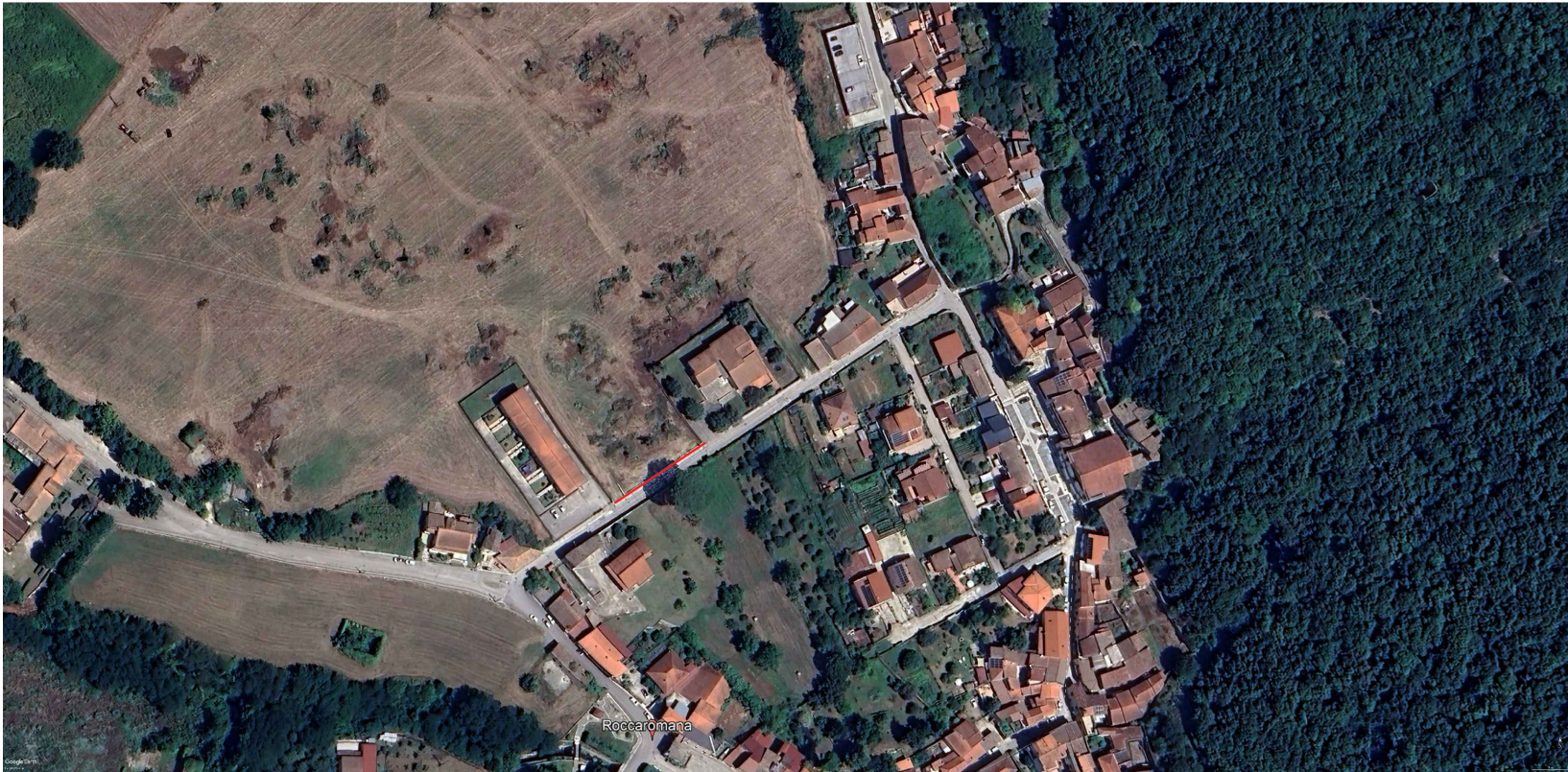
Stralcio Ortofoto con indicazione muro